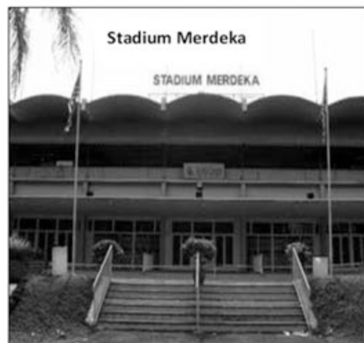
Mengenang sejarah negara