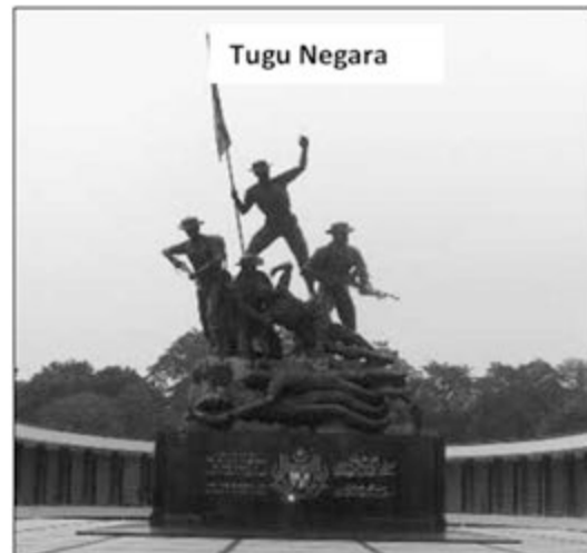
Memupuk semangat patriotik