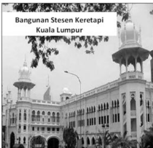
Mengekalkan nilai seni dan estetika